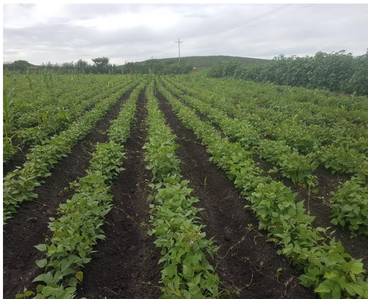
Figura 1. Predio de Frijol

Durante el mes de agosto 2021, se realizó un seguimiento en muestreo de un total de 480 hectáreas con una infestación promedio de 8.17 %.