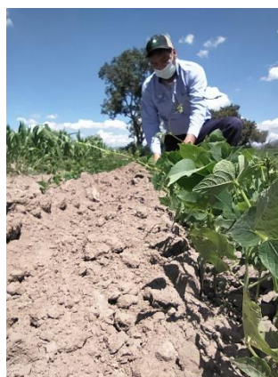
Figura 2. Acción de muestreo de conchuela de frijol ( Epilachna varivestis )