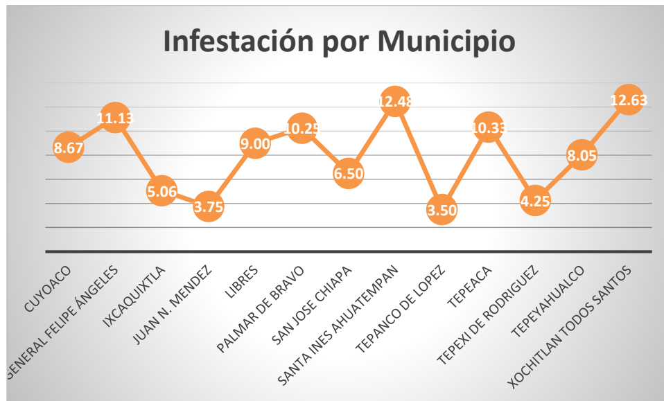
Gráfica 3. % Infestación por municipio, septiembre 2021.

De acuerdo al muestreo realizado en cada predio y las plantas positivas con insectos y/o síntomas causados por Epilachna varivestis , se registra un porcentaje de infestación mensual de 8.4% y por municipio como se muestra en la gráfica 3.